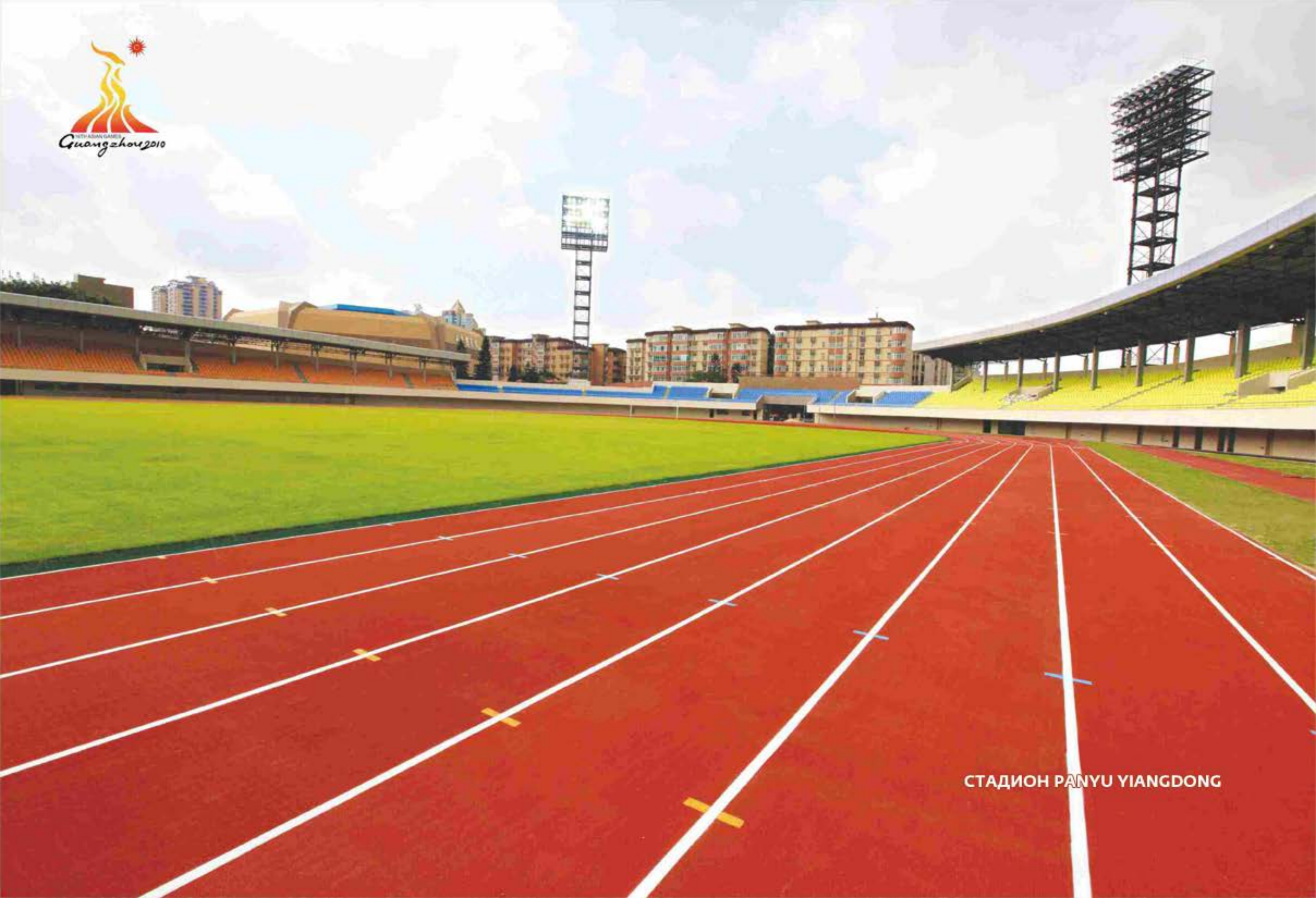
СТАДИОН ПАНЬУ ЯИАНГДОНГ